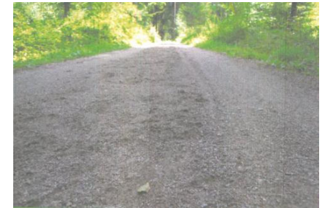
Reitweg mit Mittelstreifeneinsandung