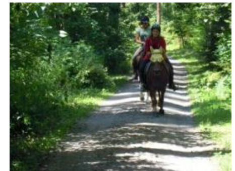
Reitweg mit Mittelstreifeneinsandung